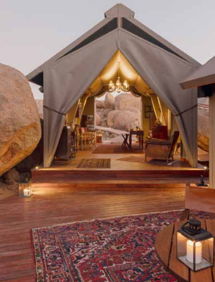
FILMREIF Das Ambiente im Sonop Zannier erinnert an den legendären Hollywood-film „Out of Africa“.

Inmitten der Millionen Jahre alten Granitfelsen hat die Zannier-Designerin ein Afrika-Ambiente wie aus den 20er Jahren erschaffen.