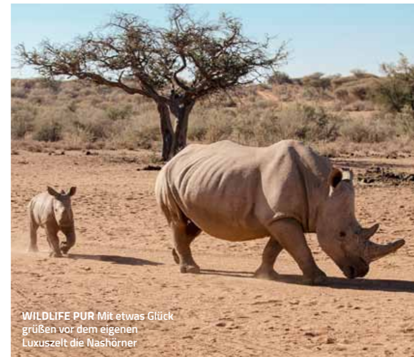
WILDLIFE PUR Mit etwas Glück grüßen vor dem eigenen Luxuszelt die Nashörner